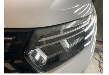
Farlar, Far camı, sol > Deforme Olmuş