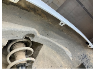
Çamurluk, sağ, Davlumbaz > Sabitlemesi Hatalı