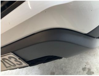
Tampon, ön, Spoiler > Sabitlemesi Hatalı