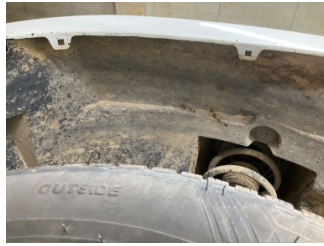
Çamurluk, sol, Davlumbaz > Sabitlemesi Hatalı