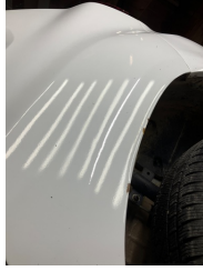
Çamurluk, sol arka, Çamurluk, sol arka > Boyası Atmış