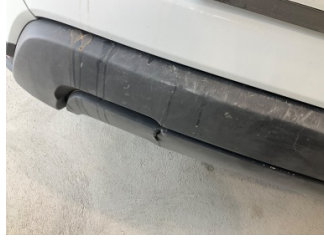
Tampon, arka, Spoiler > Hasarlı