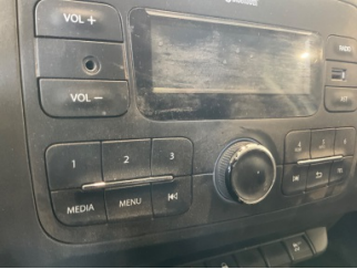
Pano/Göstergeler, Ön pano düğmeleri > Deforme Olmuş