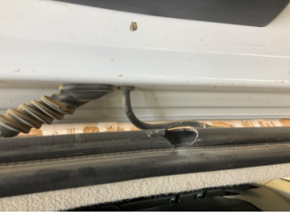
Arka bölüm, Bagaj kapağı fitili > Hasarlı

Sayfa: 5/6 Araç Çıkış Tarihi: 13.10.2025 10:27