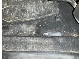
Döşemeler/Kapaklar, Döşemeler/Kapaklar > Yakıcı Madde İle Zarar Görmüş