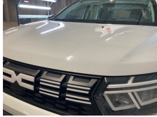
Motor kaputu, Motor kaputu > Taş İzi