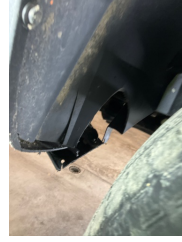
Çamurluk, sol, Davlumbaz > Hasarlı