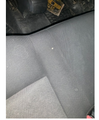
Döşemeler/Kapaklar, Döşemeler/Kapaklar > Yakıcı Madde İle Zarar Görmüş