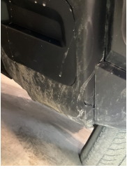
Tampon, ön, Ön tampon > Kırılmış