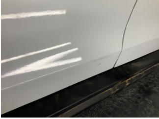
Kapı, sol ön, Kapı, sol ön > Küçük Vuruk