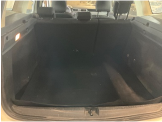
Döşemeler/Kapaklar, Pandizot > Sökülmüş-Yok