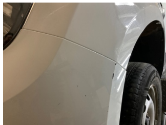
Çamurluk, sol, Çamurluk, sol > Ezik