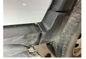
Marşbiyel, sağ, Marşbiyel plastiği, sağ > Hasarlı