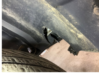
Çamurluk, sağ, Davlumbaz > Hasarlı