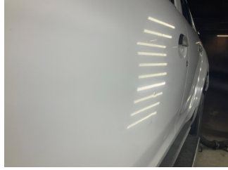
Kapı, sol ön, Kapı, sol > Noktasal Ezik