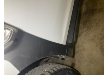
Çamurluk, sol, Nikelaj, ızgara > Çizik