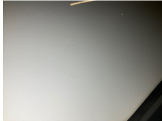
Tavan, Tavan > Çizik