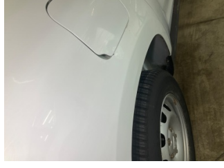
Çamurluk, sağ arka, Çamurluk, sağ arka > Vuruk