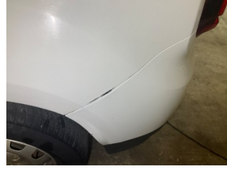
Tampon, arka, Arka tampon > Sabitlemesi Hatalı