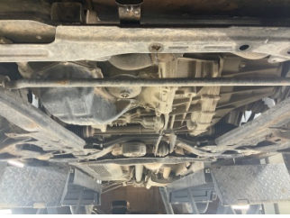
Motor, Alt muhafaza > Sökülmüş-Yok