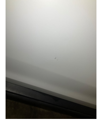
Kapı, sol ön, Kapı, sol ön > Taş Izi