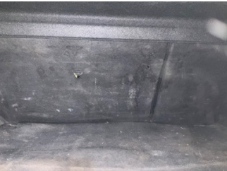
Koltuklar, arka, Arka koltuk döşemesi > Delinmiş