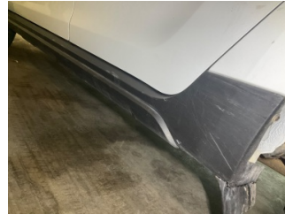
Marşbiyel, sol, Marşbiyel plastığı, sol > Çizik