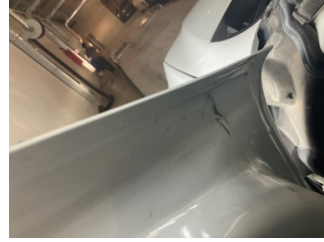
Kapı, sol ön, Kapı, sol > Boyası Atmış