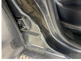
Kaporta, B-direk, sağ > Boyası Atmış