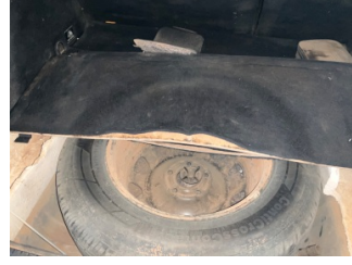
Döşemeler/Kapaklar, Döşemeler/Kapaklar > Hasarlı