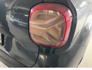
Arka lambalar, Arka lambalar, sağ > Solmuş