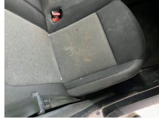
Koltuklar, arka, Arka koltuk döşemesi > Yakıcı Madde ile Zarar Görmüş