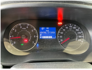
Pano/Göstergeler, Pano/Göstergeler > Uyarı Lambası Yanıyor