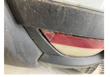
Tampon, arka, Reflektör, sağ > Hasarlı