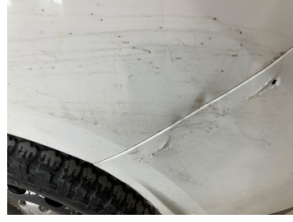
Çamurluk, sol arka, Çamurluk, sol arka > Hasarlı