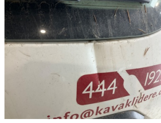
Bagaj kapağı/kapısı, Bagaj kapısı > Hasarlı