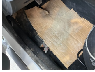
Taban, Paspaslar > Sökülmüş-Yok