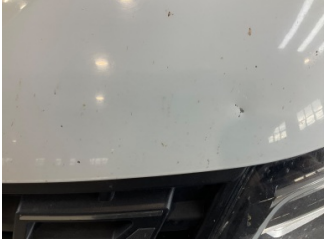
Motor kaputu, Motor kaputu > Taş Vuruğu