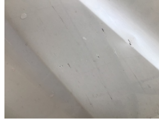
Motor kaputu, Motor kaputu > Çizik