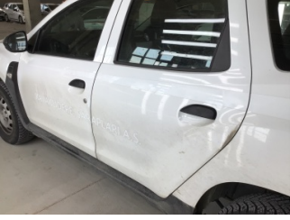
Kaporta, Kaporta > Etiket Yapıştırılmış