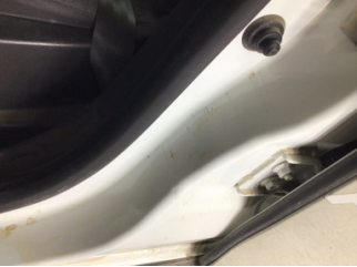
Kaporta, B-direk, sol > Çizik