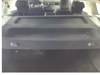
Döşemeler/Kapaklar, Pandizot > Sökülmüş-Yok