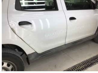
Kaporta, Kaporta > Etiket Yapıştırılmış