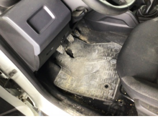
Taban, Paspaslar > Hasarlı