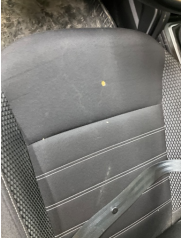
Döşemeler/Kapaklar, Döşemeler/Kapaklar > Yakıcı Madde ile Zarar Görmüş