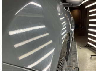
Çamurluk, sol, Çamurluk, sol > Noktasal Ezik