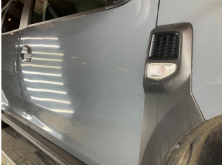
Çamurluk, sağ, Çamurluk, sağ > Çizik