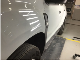
Çamurluk, sol, Çamurluk, sol > Noktasal Ezik