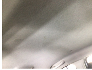
Döşemeler/Kapaklar, Tavan döşemesi > Kirlenmiş