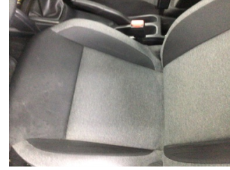
Koltuklar, ön, Koltuk, sol ön > Kirlenmiş