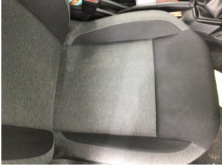
Koltuklar, ön, Koltuk, sağ ön > Kirlenmiş