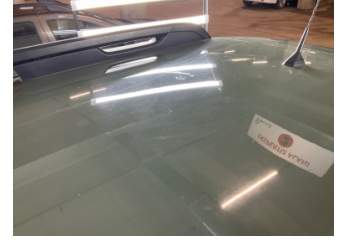
Kaporta, Kaporta > Yakıcı Madde Ile Zarar Görmüş