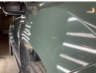
Çamurluk, sağ, Çamurluk, sağ > Vuruk