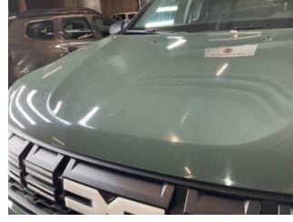
Motor kaputu, Motor kaputu > Taş İzi