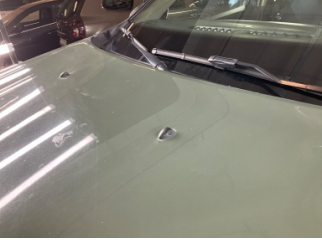
Kaporta, Kaporta > Yakıcı Madde Ile Zarar Görmüş