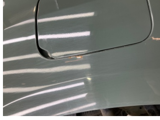
Çamurluk, sağ arka, Çamurluk, sağ arka > Boyası Atmış