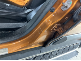
Kaporta, B-direk, sol > Çizik