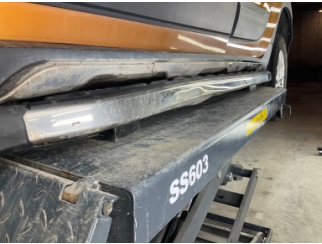
Marşbiyel, sol, Marşbiyel plastiği, sol > Ezik