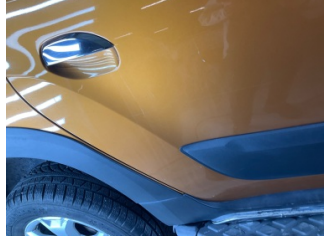
Kapı, sağ arka, Kapı, sağ arka > Küçük Çizik