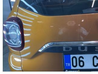
Bagaj kapağı/kapısı, Bagaj kapısı > Boyası Atmış