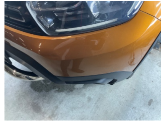
Tampon, ön, Ön tampon > Ezik