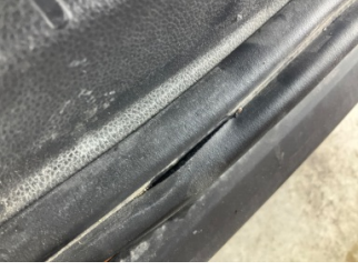
Arka bölüm, Bagaj kapağı fitili > Onaysız