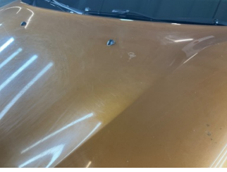
Motor kaputu, Motor kaputu > Yakıcı Madde ile Zarar Görmüş