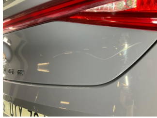
Bagaj kapağı/kapısı, Bagaj kapısı > Çizik