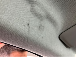
Döşemeler/Kapaklar, Tavan döşemesi > Yakıcı Madde ile Zarar Görmüş