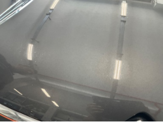
Motor kaputu, Motor kaputu > Deforme Olmuş