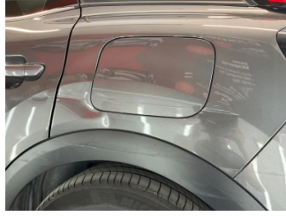
Çamurluk, sol arka, Çamurluk, sol arka > Hasarlı