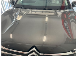
Motor kaputu, Motor kaputu > Deforme Olmuş