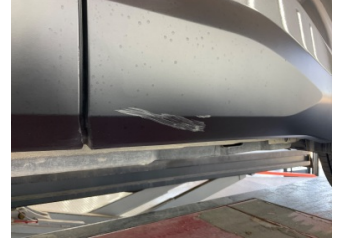
Kapı, sol arka, Kapı bandı > Hasarlı