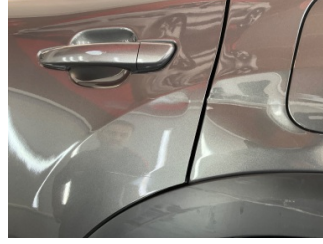
Kapı, sol arka, Kapı, sol arka > Hasarlı