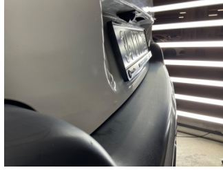
Bagaj kapağı/kapısı, Bagaj kapısı > Standart Dışı Onarım