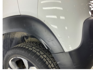
Çamurluk, sol arka, Nikelaj > Çizik