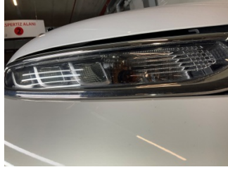
Farlar, Far camı, sağ > Küçük Çizik