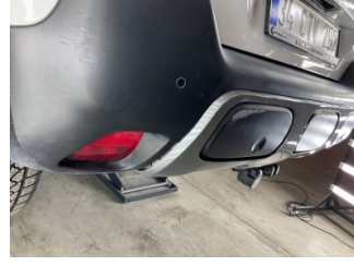
Tampon, ön, Spoiler > Sabitlemesi Hatalı