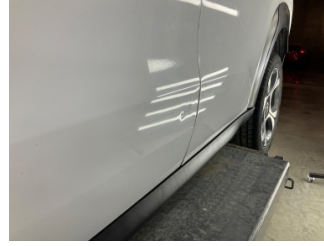
Kapı, sol arka, Kapı, sol arka > Noktasal Ezik