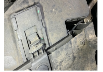
Motor, Hava filtresi kabı > Kırılmış