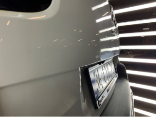
Bagaj kapağı/kapısı, Bagaj kapısı > Standart Dışı Onarım