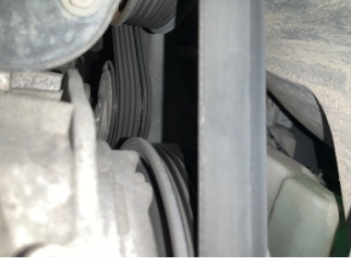
Motorsoğutması, Kayış > Çatlak