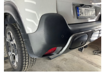
Tampon, arka, Arka tampon > Boyası Atmış