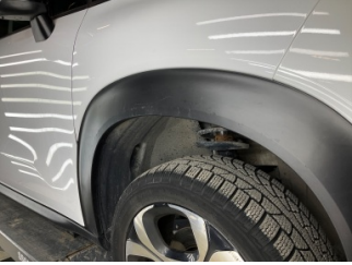
Çamurluk, sağ, Nikelaj, ızgara > Çizik