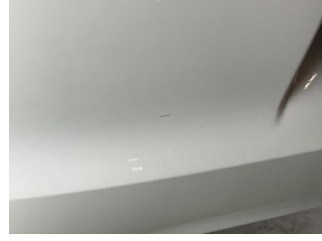
Tampon, arka, Arka tampon > Küçük Çizik