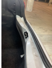
Döşemeler/Kapaklar, Yükleme eşiği kaplaması > Boyası Atmış