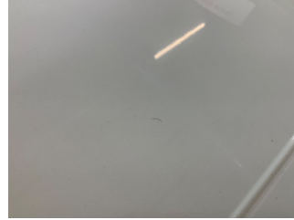
Tavan, Tavan > Boyası Atmış