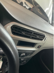
Kalorifer/Klima, Havalandırma ızgarası > Sabitlemesi Hatalı