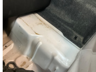
Döşemeler/Kapaklar, Yükleme eşiği kaplaması > Boyası Atmış