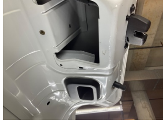
Bagaj kapağı/kapısı, Bagaj kapısı > Boyası Atmış