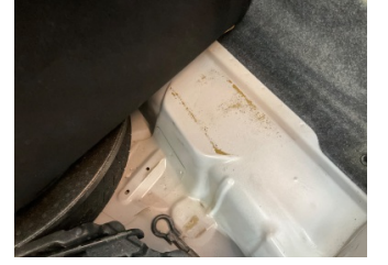
Arka bölüm, Bagaj havuzu > Boyası Atmış