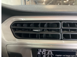
Kalorifer/Klima, Havalandırma ızgarası > Sabitlemesi Hatalı