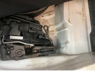
Arka bölüm, Bagaj havuzu > Boyası Atmış