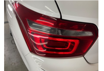
Arka lambalar, Arka lambalar, sol > Çizik