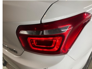
Arka lambalar, Arka lambalar, sağ > Çizik