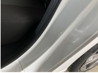
Kaporta, C-direk, sol > Küçük Çizik