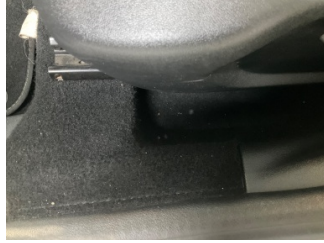
Taban, Taban halısı > Yakıcı Madde ile Zarar Görmüş