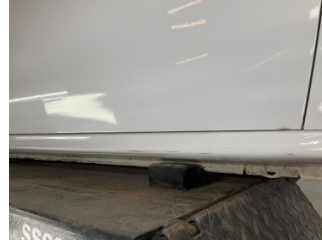
Marşbiyel, sağ, Marşbiyel, sağ > Çizik