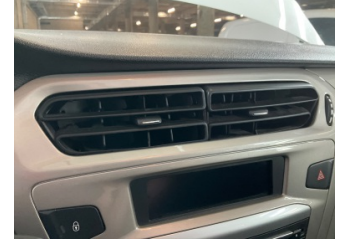
Kalorifer/Klima, Havalandırma ızgarası > Hasarlı