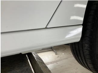
Marşbiyel, sol, Marşbiyel, sol > Çizik