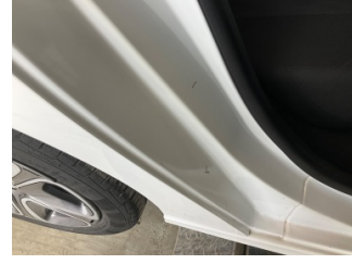
Kaporta, C-direk, sağ > Küçük Çizik