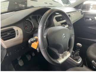
Direksiyon sistemi, Direksiyon > Deforme Olmuş