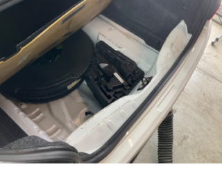
Döşemeler/Kapaklar, Yükleme eşiği kaplaması > Ezik