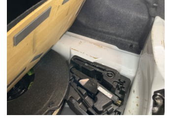
Arka bölüm, Bagaj havuzu > Boyası Atmış