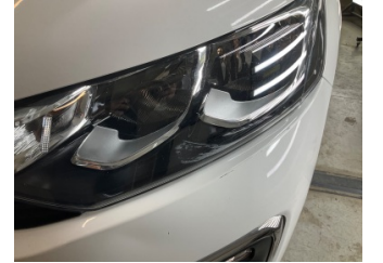
Farlar, Far camı, sol > Çizik