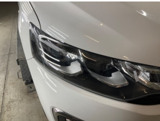
Farlar, Far camı, sağ > Çizik