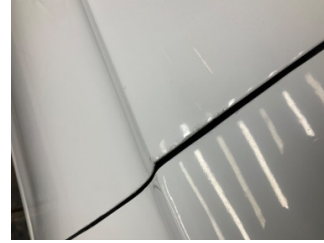
Kapı, sağ ön, Kapı, sağ ön > Standart Dışı Onarım