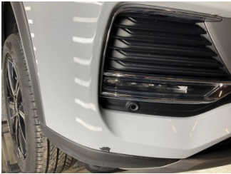
Tampon, ön, Ön tampon > Küçük Çizik