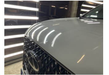
Motor kaputu, Motor kaputu > Noktasal Ezik