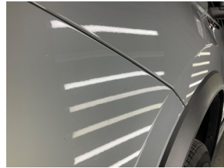
Çamurluk, sol, Çamurluk, sol > Noktasal Ezik