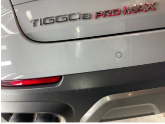
Tampon, arka, Arka tampon > Vuruk