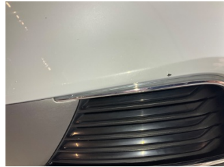
Tampon, ön, Ön tampon > Küçük Çizik