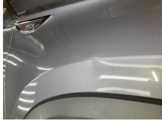
Çamurluk, sağ, Çamurluk, sağ > Küçük Vuruk