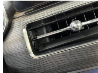
Kalorifer/Klima, Havalandırma izgarası sabitlemesi > Hasarlı