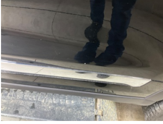
Kapı, sol arka, Kapı, sol arka > Taş Izi