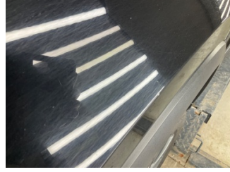
Çamurluk, sol, Çamurluk, sol > Taş Izi