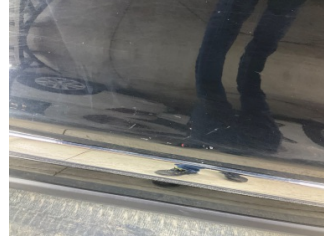
Kapı, sağ ön, Kapı, sağ > Noktasal Ezik