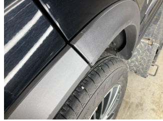
Kapı, sağ arka, Nikelaj, alt > Çizik