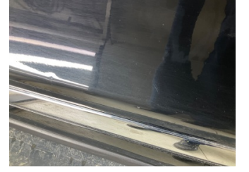
Kapı, sol ön, Kapı, sol > Noktasal Ezik