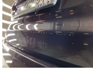
Bagaj kapağı/kapısı, Bagaj kapısı > Standart Dışı Onarım