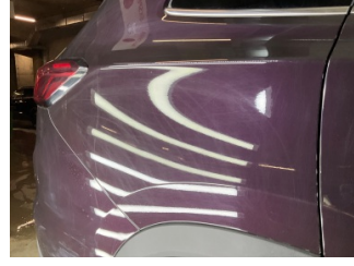
Çamurluk, sağ arka, Çamurluk, sağ arka > Yüzeysel Çizik