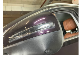
Dikiz aynası, sol, Sinyal lambası > Küçük Çizik