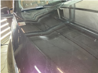
Motor kaputu, Motor kaputu > Çizik