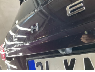
Bagaj kapağı/kapısı, Bagaj kapısı > Standart Dışı Onarım