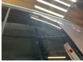
Kaporta, Kaporta > Deforme Olmuş