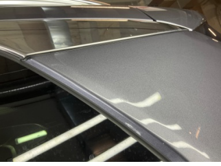
Kaporta, Kaporta > Deforme Olmuş