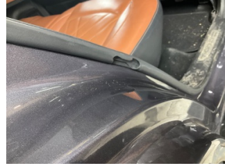
Kapı, sağ arka, Kapı fitili > Hasarlı