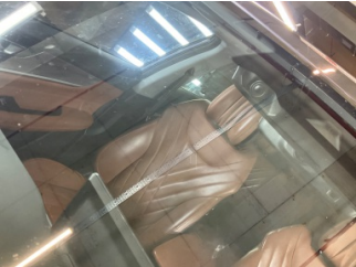
Camlar, Ön cam > Çatlak