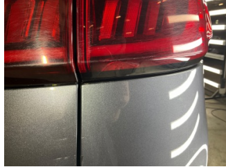
Arka lambalar, Arka lamba camı, sağ > Hasarlı