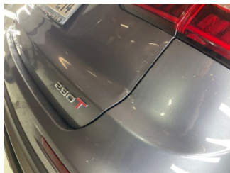
Bagaj kapağı/kapısı, Arka spoyler > Ezik