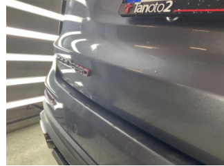
Bagaj kapağı/kapısı, Bagaj kapısı > Standart Dışı Onarım