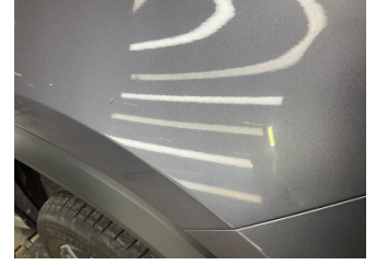
Çamurluk, sağ, Çamurluk, sağ > Boyası Atmış