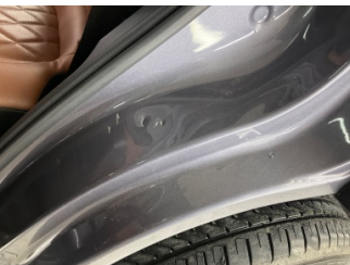
Kaporta, C-direk, sol > Ezik