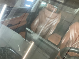
Camlar, Ön cam > Çizik