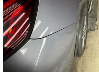
Tampon, arka, Arka tampon > Sabitlemesi Hatalı