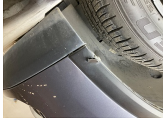
Çamurluk, sağ, Nikelaj, ızgara > Kırılmış