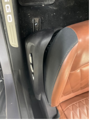
Koltuklar, ön, Koltuk çerçevesi altı, sol ön > Sabitlemesi Hatalı