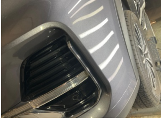
Tampon, ön, Ön tampon > Küçük Çizik