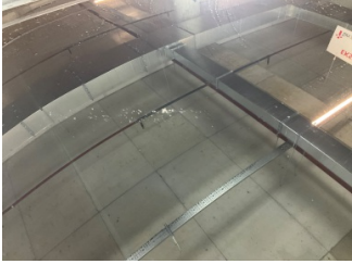
Tavan, Sunroof > Çizik