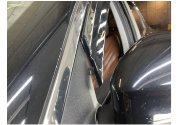
Kapı, sol ön, Nikelaj, üst > Kırılmış