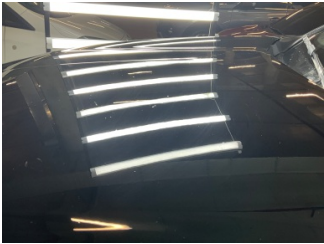
Motor kaputu, Motor kaputu > Standart Dışı Onarım