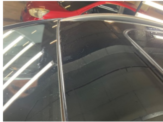
Tavan, Tavan, ön cam üstü > Standart Dışı Onarım