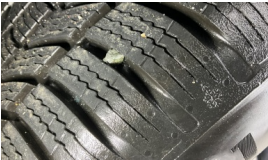
Lastik, sol arka > Standart Dışı Onarım