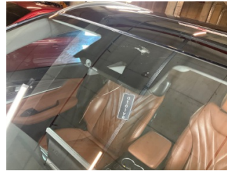
Camlar, Ön cam > Hasarlı