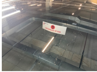
Tavan, Sunroof > Çizik