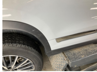
Kapı, sağ arka, Kapı bandı > Çizik