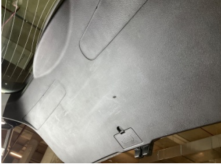
Döşemeler/Kapaklar, Bagaj kapağı, iç döşemesi > Küçük Çizik