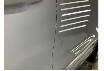
Kapı, sol ön, Kapı, sol > Çizik