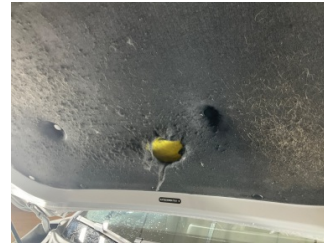
Motor kaputu, İzolasyon döşemesi > Hasarlı