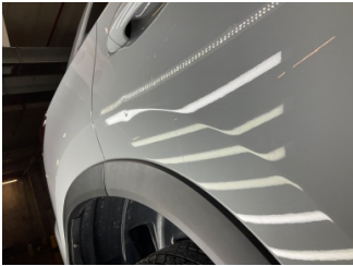
Kapı, sağ arka, Kapı, sağ arka > Noktasal Ezik