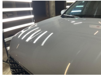
Motor kaputu, Motor kaputu > Yakıcı Madde ile Zarar Görmüş