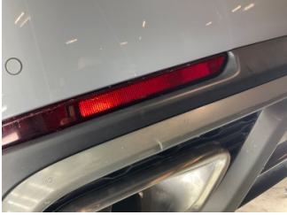
Tampon, arka, Spoiler > Vuruk