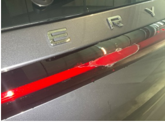
Arka lambalar, Arka lamba camı, sağ > Hasarlı