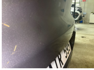
Bagaj kapağı/kapısı, Bagaj kapısı > Standart Dışı Onarım