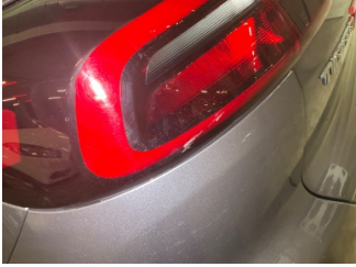
Arka lambalar, Arka lamba camı, sol > Çizik