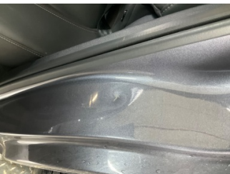
Kaporta, C-direk, sol > Ezik