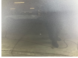
Kapı, sağ ön, Kapı, sağ > Noktasal Ezik