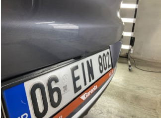
Bagaj kapağı/kapısı, Bagaj kapısı > Standart Dışı Onarım