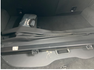
Döşemeler/Kapaklar, Pandizot > Sabitlemesi Hatalı