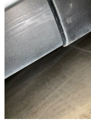
Kapı, sol arka, Nikelaj, alt > Sabitlemesi Hatalı