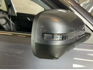
Dikiz aynası, sağ, Sinyal lambası > Çizik