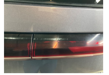
Arka lambalar, Arka lamba camı, sağ > Hasarlı