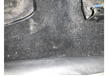
Taban, Taban halısı > Yakıcı Madde ile Zarar Görmüş