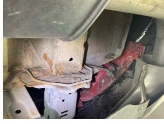
Kaporta, Sol Arka Şase > Ezik