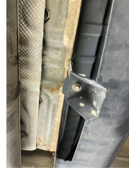
Arka bölüm, Bagaj havuzu > Ezik