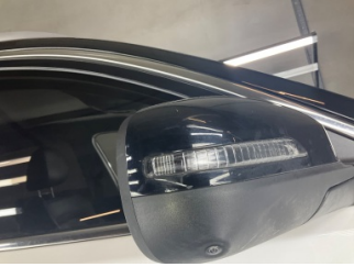
Dikiz aynası, sağ, Sinyal lambası > Çizik