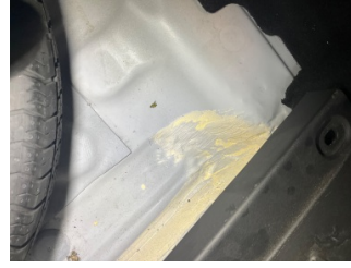
Arka bölüm, Bagaj havuzu > Standart Dışı Onarım