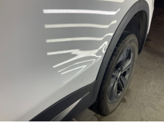
Kapı, sol arka, Kapı, sol arka > Ezik