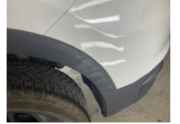
Çamurluk, sol arka, Nikelaj > Çizik