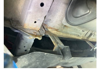
Arka bölüm, Arka sac/panel > Ezik