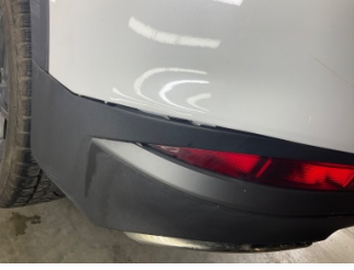
Tampon, arka, Spoiler > Sabitlemesi Hatalı