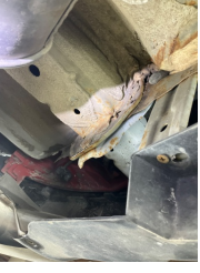
Kaporta, Sağ Arka Şase > Ezik