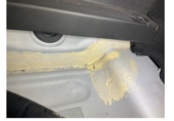
Arka bölüm, Bagaj havuzu > Standart Dışı Onarım