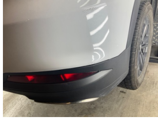
Tampon, arka, Spoiler > Sabitlemesi Hatalı