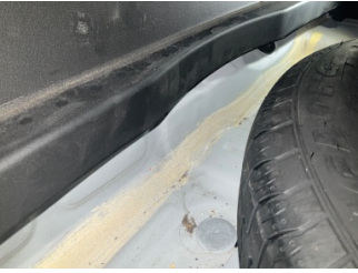
Arka bölüm, Arka sac/panel > Standart Dışı Onarım