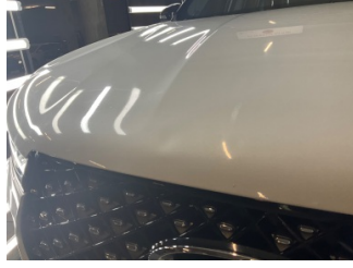
Motor kaputu, Motor kaputu > Ezik