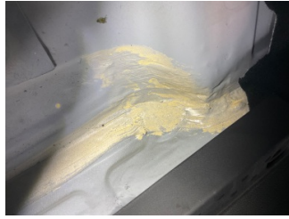
Arka bölüm, Arka sac/panel > Standart Dışı Onarım