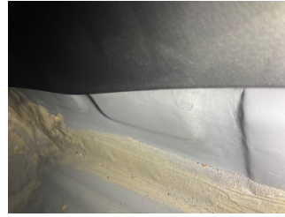
Arka bölüm, Arka sac/panel > Standart Dışı Onarım