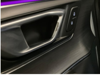
Kapı, sol ön, Kapı kolu, iç > Onaysız