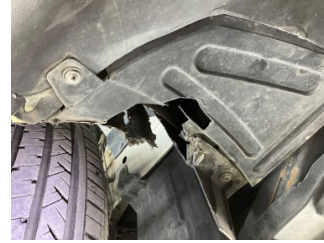
Tampon, arka, Tampon koruyucu orta > Hasarlı