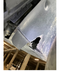
Çamurluk, sağ, Davlumbaz > Hasarlı