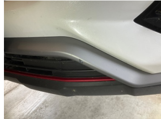
Tampon, ön, Spoiler > Küçük Çizik