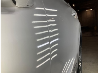
Kapı, sol arka, Kapı, sol arka > Noktasal Ezik