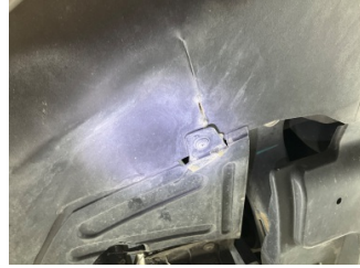
Tampon, ön, Spoiler > Standart Dışı Onarım