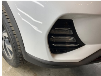
Tampon, ön, Ön tampon > Küçük Çizik