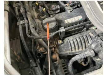
Motor, Yağ seviyesi > Eksik