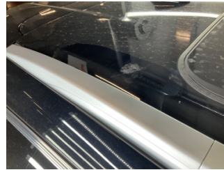
Tavan, Tavan > Yakıcı Madde İle Zarar Görmüş