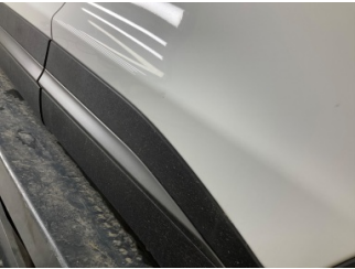
Kapı, sol arka, Kapı, sol arka > Noktasal Ezik