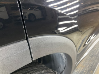
Kapı, sağ arka, Kapı, sağ arka > Vuruk