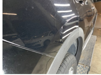
Çamurluk, sağ arka, Çamurluk, sağ arka > Vuruk