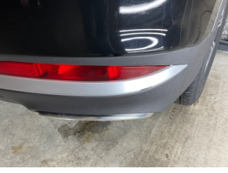
Tampon, arka, Arka tampon > Küçük Çizik