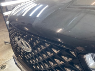
Kaporta, Kaporta > Taş İzi