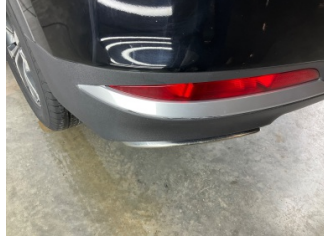
Tampon, arka, Arka tampon > Küçük Çizik