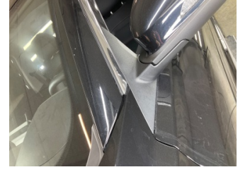
Kaporta, Kaporta > Taş İzi