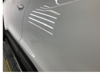
Kapı, sol arka, Kapı, sol arka > Noktasal Ezik