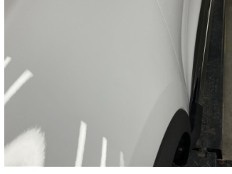
Çamurluk, sol, Çamurluk, sol > Noktasal Ezik