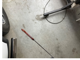
Motor, Yağ seviyesi > Eksik