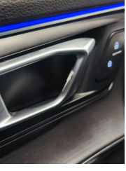
Kapı, sol ön, Kapı kolu, iç > Deforme Olmuş