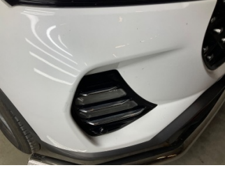
Tampon, ön, Ön tampon > Rötüş