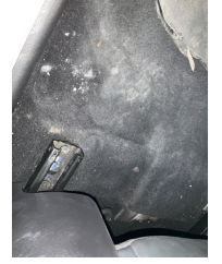
Taban, Taban halısı > Yakıcı Madde ile Zarar Görmüş