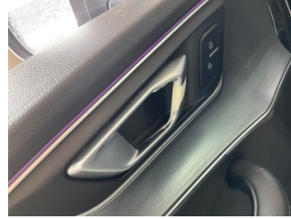
Kapı, sol ön, Kapı kolu, iç > Deforme Olmuş