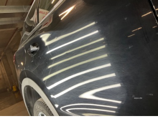
Kapı, sağ arka, Kapı, sağ arka > Noktasal Ezik