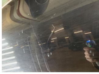
Kapı, sağ ön, Kapı, sağ ön > Küçük Çizik