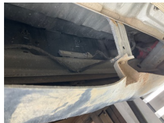
Tampon, arka, Bağlantı ayağı > Vuruk