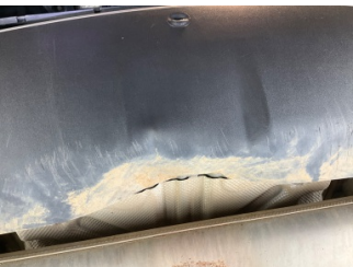
Tampon, arka, Reflektör, sol > Ezik