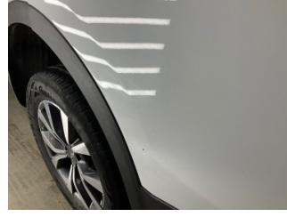
Kapı, sağ arka, Kapı, sağ arka > Vuruk