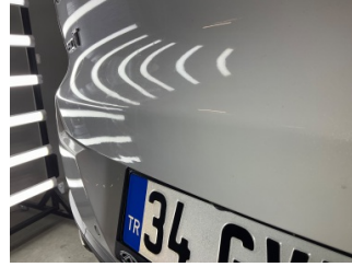
Bagaj kapağı/kapısı, Bagaj kapısı > Standart Dışı Onarım