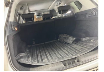
Döşemeler/Kapaklar, Pandizot > Sökülmüş-Yok