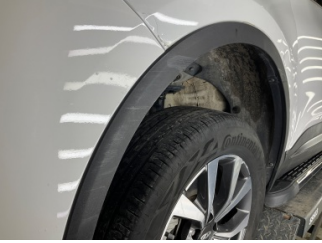
Çamurluk, sol, Nikelaj, ızgara > Çizik