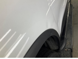
Çamurluk, sol, Çamurluk, sol > Ezik