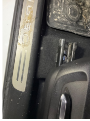
Taban, Taban halısı > Yakıcı Madde ile Zarar Görmüş