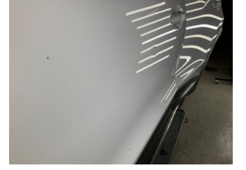
Kapı, sol ön, Kapı, sol ön > Vuruk