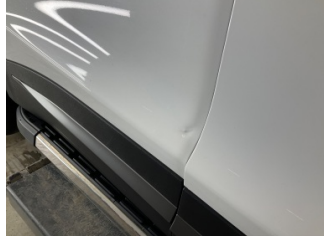
Kapı, sağ arka, Kapı, sağ arka > Vuruk