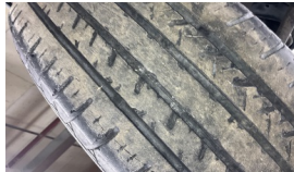
Tekerlek seti > Çatlak