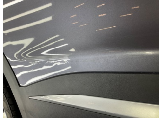
Kapı, sağ arka, Kapı, sağ arka > Standart Dışı Onarım