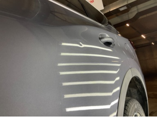
Kapı, sol arka, Kapı, sol arka > Noktasal Ezik