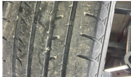
Tekerlek seti > Çatlak