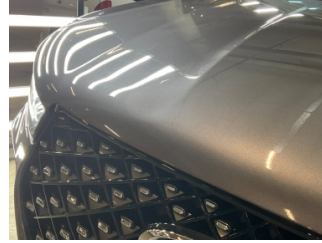
Motor kaputu, Motor kaputu > Küçük Vuruk