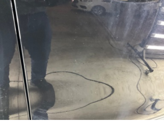
Kapı, sağ ön, Kapı, sağ > Noktasal Ezik