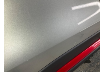
Kapı, sağ arka, Kapı, sağ arka > Küçük Çizik