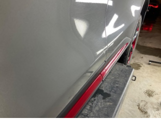
Kapı, sol ön, Kapı, sol ön > Vuruk