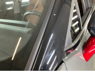
Tavan, Ön cam direği, sol > Taş Izi