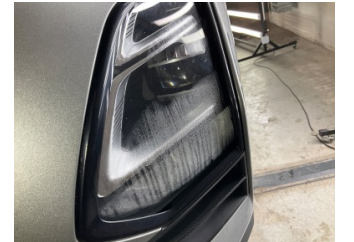
Farlar, Far camı, sol > Islak-Nemli