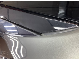
Çamurluk, sol arka, Nikelaj > Sabitlemesi Hatalı