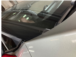
Tavan, Ön cam direği, sağ > Taş Izi