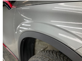
Çamurluk, sağ, Çamurluk, sağ > Noktasal Ezik