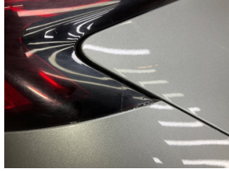
Arka lambalar, Geri Vites lambası, sağ > Hasarlı