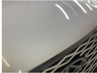
Kaporta, Kaporta > Taş Izi