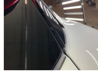
Çamurluk, sağ arka, Nikelaj > Sabitlemesi Hatalı