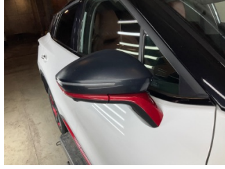
Dikiz aynası, sol, Dış dikiz aynası kapağı > Solmuş