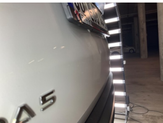
Bagaj kapağı/kapısı, Bagaj kapısı > Vuruk