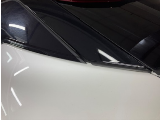
Çamurluk, sol arka, Nikelaj > Ayarsız