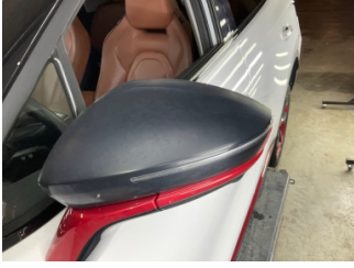
Dikiz aynası, sol, Dış dikiz aynası kapağı > Solmuş