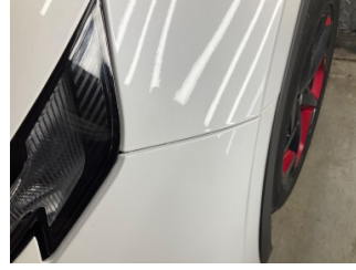
Tampon, ön, Ön tampon > Ayarsız