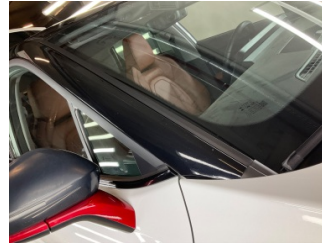
Kaporta, Kaporta > Taş Izi