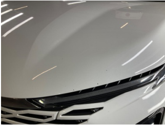
Kaporta, Kaporta > Taş Izi