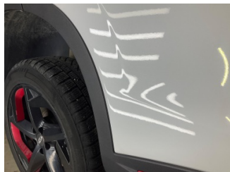
Kapı, sağ arka, Kapı, sağ arka > Vuruk