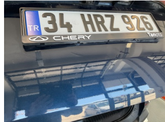
Bagaj kapağı/kapısı, Bagaj kapısı > Standart Dışı Onarım