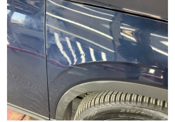
Çamurluk, sağ, Çamurluk, sağ > Standart Dışı Onarım