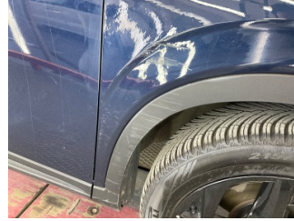
Çamurluk, sağ, Çamurluk, sağ > Hasarlı