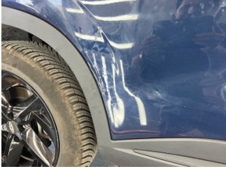
Kapı, sağ arka, Kapı, sağ arka > Standart Dışı Onarım