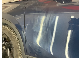
Kapı, sol ön, Kapı, sol ön > Deforme Olmuş