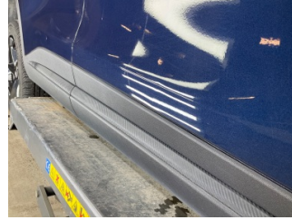
Kapı, sağ ön, Kapı, sağ ön > Vuruk