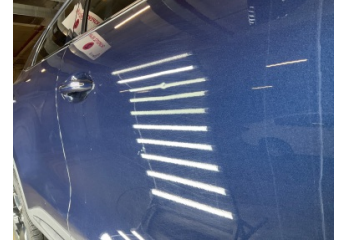
Kapı, sağ ön, Kapı, sağ ön > Vuruk