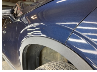
Çamurluk, sağ, Çamurluk, sağ > Standart Dışı Onarım