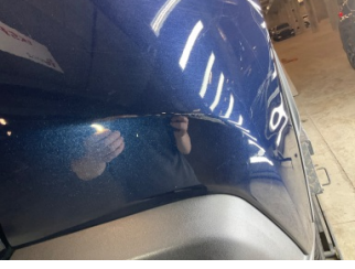
Tampon, arka, Arka tampon > Küçük Çizik