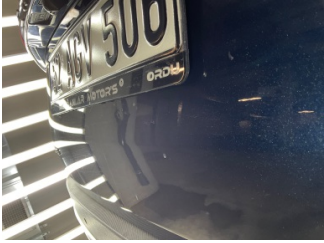
Bagaj kapağı/kapısı, Bagaj kapısı > Vuruk