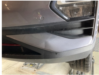
Tampon, ön, Ön tampon > Ezik