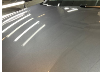
Motor kaputu, Motor kaputu > Yakıcı Madde ile Zarar Görmüş