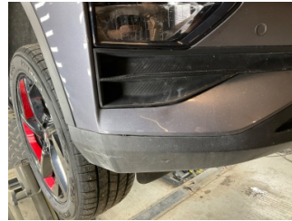
Tampon, ön, Ön tampon > Ezik