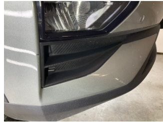
Tampon, ön, Ön tampon > Küçük Çizik