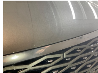
Motor kaputu, Motor kaputu > Taş Izı