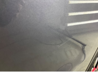
Kapı, sol arka, Kapı, sol arka > Küçük Çizik