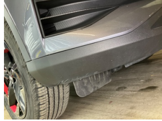
Tampon, ön, Spoiler > Çizik