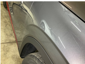
Çamurluk, sağ, Çamurluk, sağ > Vuruk