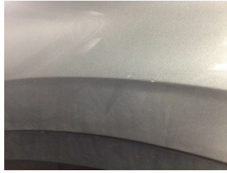
Çamurluk, sol, Çamurluk, sol > Küçük Çizik