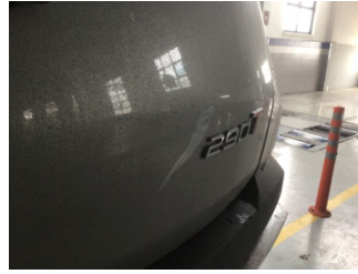
Bagaj kapağı/kapısı, Bagaj kapısı > Noktasal Ezik