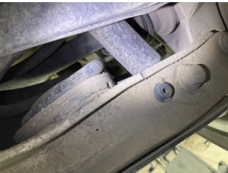
Arka aks, Aksgövdesi, arka > Onaysız