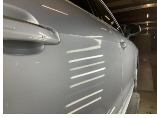
Kapı, sağ arka, Kapı, sağ arka > Vuruk