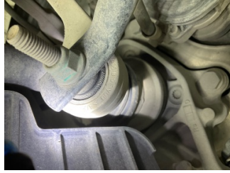
Arka aks, Aksgövdesi, arka > Onaysız