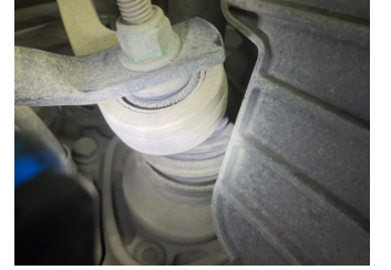
Arka aks, Aksgövdesi, arka > Onaysız