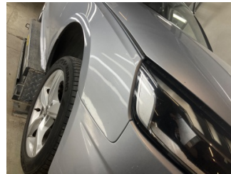
Çamurluk, sağ, Çamurluk, sağ > Standart Dışı Onarım