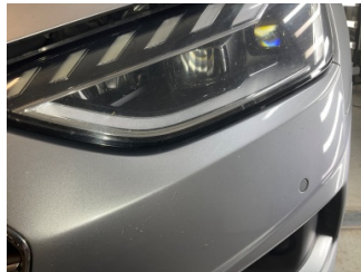
Tampon, ön, Ön tampon > Sabitlemesi Hatalı