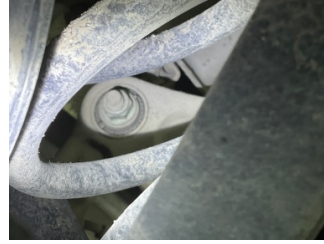
Arka aks, Aksgövdesi, arka > Onaysız