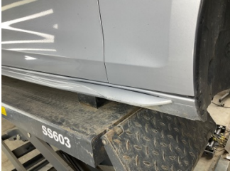
Marşbiyel, sağ, Marşbiyel plastiği, sağ > Çizik