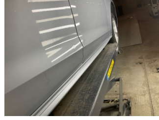
Kapı, sağ arka, Kapı, sağ arka > Vuruk